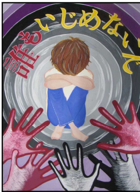
善防中3年 川原 朱理