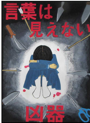
北条中2年 田中 希実