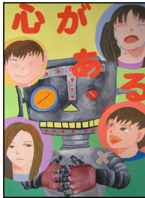
加西中2年 難波 拓己