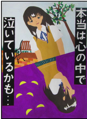
加西中3年 三宅 楓香