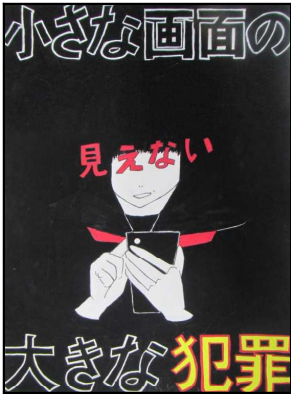
泉中3年 山口 絢華