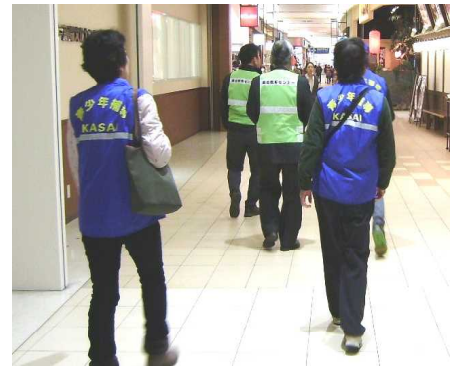
量販店での巡回補導