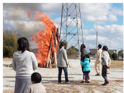
健康に過ごせますように…

今年もたくさんの方々にご支援をいただき、新春のつどいの全日程を無事終えることができました。ありがとうございました。