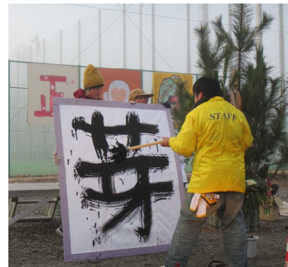
いろいろなことが芽生える…

今年は500人という大勢の参加者と天候に恵まれ、盛大に開催できましたことで、年末からの準備の疲れも癒やされました。来年も、お待ちしております。