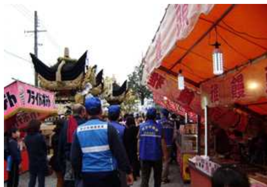
【節句祭り巡回補導風景】

補導委員は、青色ベストと帽子を着用して巡回することにより、地域の青少年が健全に育つことを喜びや誇りに思っ活動が続けられています。これからも地域の青少年が健やかに明るく育っていくように、ご尽力いただきますようお願いします。