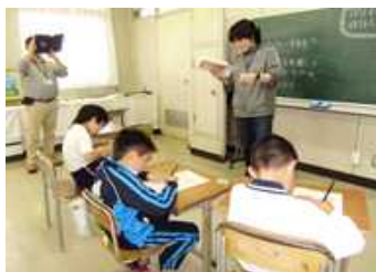
自己表現「スキルアップ学習」の様子