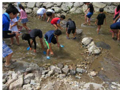
さあ、つかまえるぞ！

貴重な体験をとおり、様々な学びや、満足感を得ることができた夏休みの一日となりました。