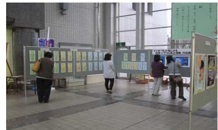
昨年度の作品展の様子

※ 作品展終了後は、各学校で持ち回り展を開催します。詳しくは、総合教育センターまでお問い合わせください。