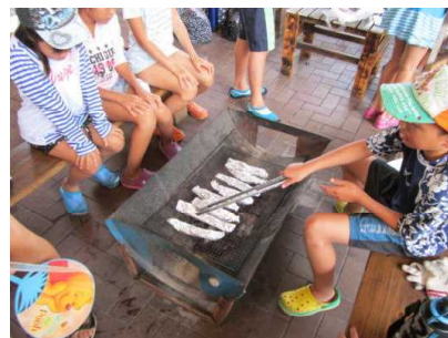
そろそろ焼けたかな？