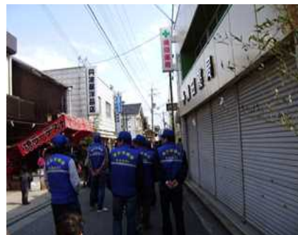
節句祭り巡回補導風景

補導委員は、青色ベストと帽子を着用して巡回することにより、地域の青少年が健全に育つことを喜びや誇りに思っ活動が続けていただいています。これからも地域の青少年が健やかに明るく育っていくように、ご尽力いただきますようお願いいたします。