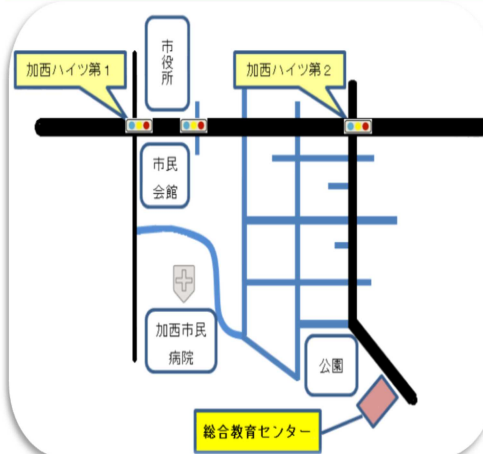
総合教育センターの地図