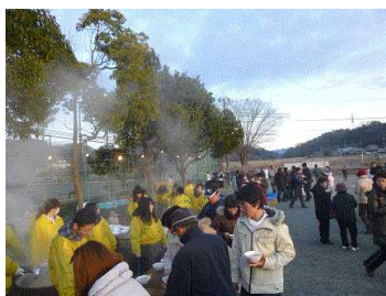
熱いお雑煮をどうぞ！

す。お正月といえば「新春のつどい」。元旦だけではありません。年末から大根の収穫やお雑煮の準備など、大晦日まで大忙しとなります。家族や知人からは「お正月くらい」との声も聞こえてきますが、30名を超えるボランティアの仲間たちと過ごす年末年始は私にとって特別な時間です。1年のスタートがいつも笑顔であふれます。