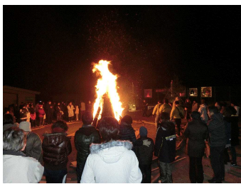
たき火のまわりで

日の出前のアrajinスタジアム東側駐車場のたき火の周りは、早朝にもかかわらずたくさんの方が集まり、大きな輪ができました。