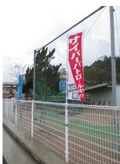
サイバーパトロール中

に巡回していますが、現在のところ、大きな問題もなく穏やかな日々が続いています。これも日頃の各家庭の教育、学校の指導のおかげだとありがたく思っています。