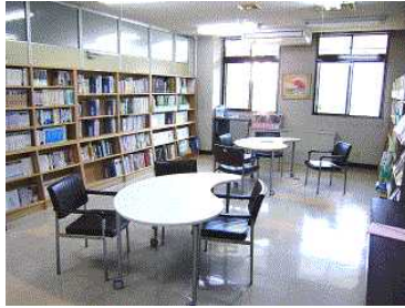
図書コーナーの全景

センターの蔵書は、大きく分けて「図書」、「雑誌」、「視聴覚資料」の三つに分類されます。平成24年12月末現在の蔵書数は、図書が805冊、雑誌が1673冊、視聴覚資料が499点です。