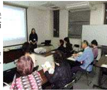
読み聞かせのために